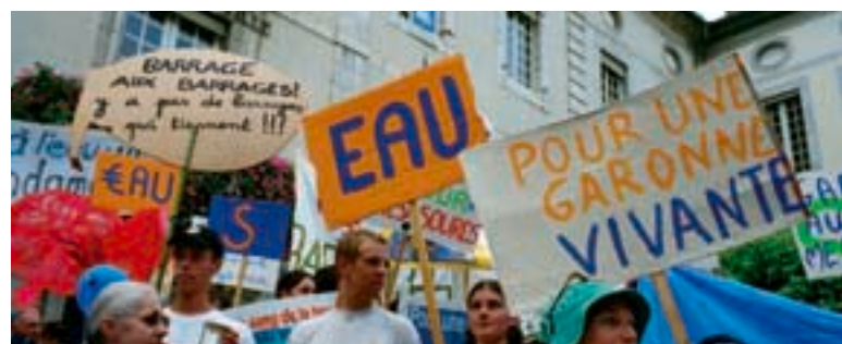
Marche pour l'eau vivante à St Gaudens (31)

(2) Jean-François Poncet est également Président du Conseil Général du Lot-et-Garonne