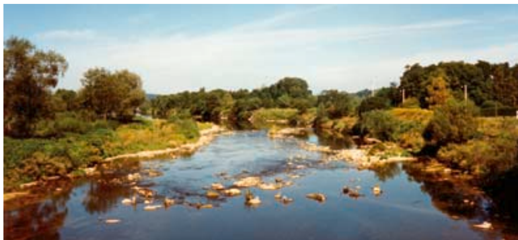
Moselle en amont de Thaon-les-Vosges (88)

Malgré cela, la Moselle parvient à conserver une qualité hydrobiologique relativement satisfaisante, assez bien représentée par un peuplement piscicole dit de transition, avec cohabitation d'espèces typiques de seconde catégorie (gardons, brochets, perches, carpes, chevesnes, etc.) et d'espèces plus sensibles