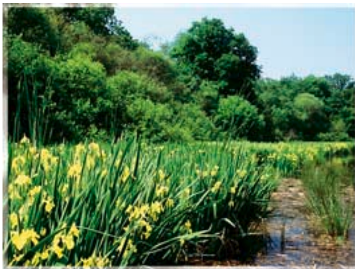
Zone humide

Derrière les mots barbares de "participation active des acteurs concernés", on retrouve le concept d'une concertation étroite avec certains acteurs organisés (acteurs économiques, associations, administrations, élus, etc.), dont les Comités de bassins, les Commissions géographiques et les Commissions Locales de l'Eau constituent déjà l'ossature. Reste néanmoins à faire en sorte que l'expression citoyenne trouve toute sa place dans ces instances. La représentation respective des différents acteurs de l'eau, maintes fois dénoncée dans la Lettre Eau, reste en effet nettement déséquilibrée. Une révision de leur composition et un élargissement de la place accordée aux associations citoyennes de consommateurs, de protection de l'environnement ou de pêcheurs, ne seraient sans doute pas du luxe.