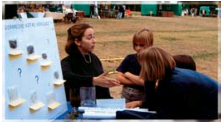
Animation sur la pollution liée aux véhicules assurée par Nature Centre lors de la fête de la nature (41)

Il est important néanmoins de noter que le financement des actions associatives pourrait constituer une voie logique de pérennisation des emplois-jeunes, ceux-ci évoluant si nécessaire vers de nouvelles missions conformes à la montée en puissance des besoins en terme de participation du public dans le domaine de l'eau.