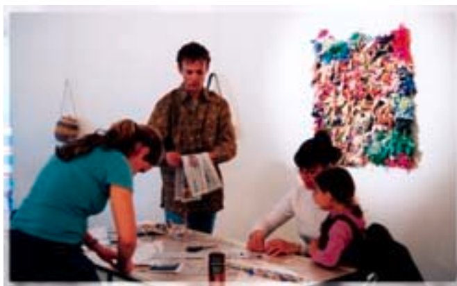
Animation assurée par l'association Débrouille Compagnie à la Médiathèque d'Orléans, dans le cadre de l'opération "Récup'ère" (45)

De fait, en dehors de la participation aux différentes instances de concertation existantes, la sensibilisation du public et l'éducation à l'environnement ont constitué les axes majeurs d'action développés jusqu'à présent par le mouvement associatif. Ce développement s'est appuyé sur la mobilisation d'outils pédagogiques aujourd'hui maîtrisés, au travers par exemple d'animations scolaires et de sorties nature.