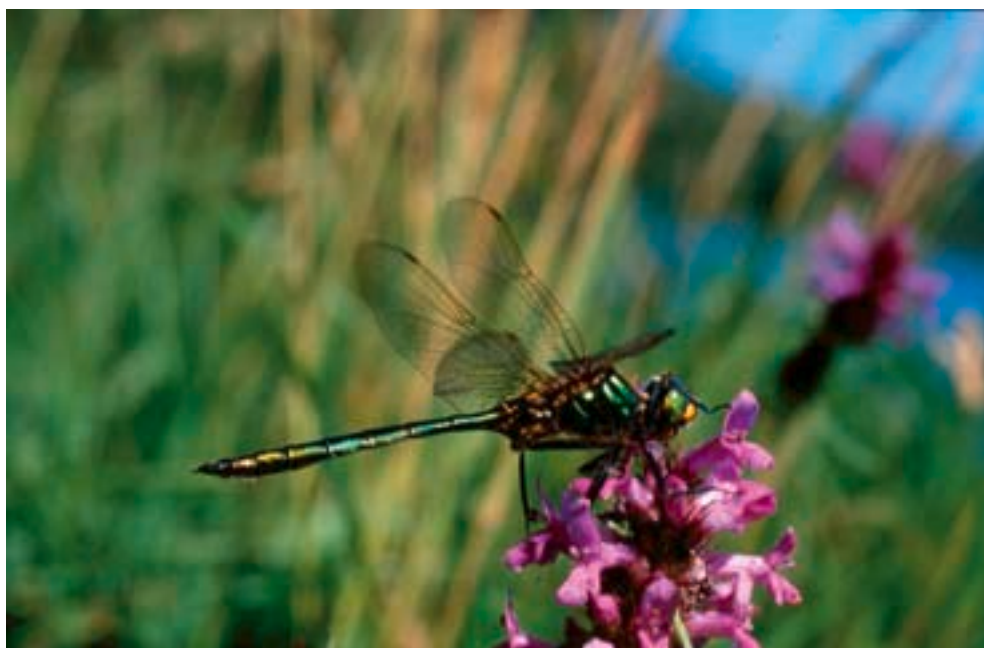
Libellule Somatochlora metallica