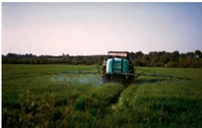
Traitement phytosanitaire

En plus, quand on fait des analyses, on ne peut détecter que ce que l'on cherche, et au delà d'un certain seuil de détection. Mais en réalité, une foule immense de molécules en tout genre, produites par l'activité humaine, et diffusées à tort et à travers, circulent dans les milieux à l'état de traces, et sortent même du robinet, le plus souvent non détectées (voir Lettre Eau 23). Tout le long de leur parcours, ces molécules, en éliminant les espèces sensibles, réduisent la robustesse biologique des milieux naturels, d'où la réduction de leur capacité épuratoire, donc de leur aptitude à fournir de l'eau facilement potabilisable !