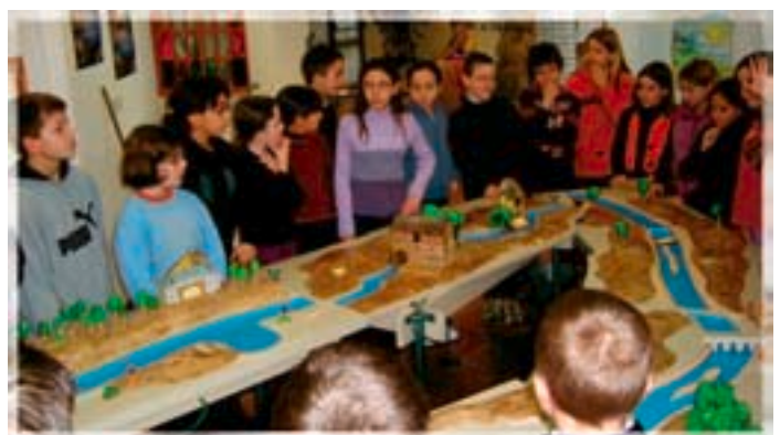
Animation "A la découverte de l'eau et du Loiret" assurée par l'Association pour la Protection du Site du Loiret, autour d'une maquette représentant la rivière (45)