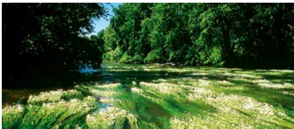
Le Loiret envahi par les renoncules d'eau (45)