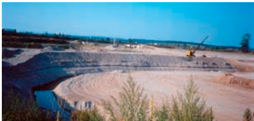
Exploitation d'une carrière

La nappe d'accompagnement de ce qui n'est encore qu'un grand torrent constitue une ressource potentielle en eau potable de qualité, très sensible cependant aux pollutions, comme la plupart des nappes alluviales. Une bonne partie de l'eau potable utilisée sur le secteur provient d'ailleurs de la matrice alluvionnaire, qui présente des transmissivités (1) conséquentes et donc un