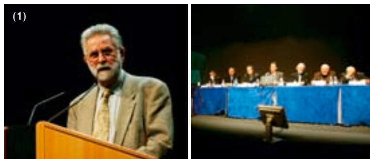
Séance de clôture du débat public sur Charlas à Toulouse (31)