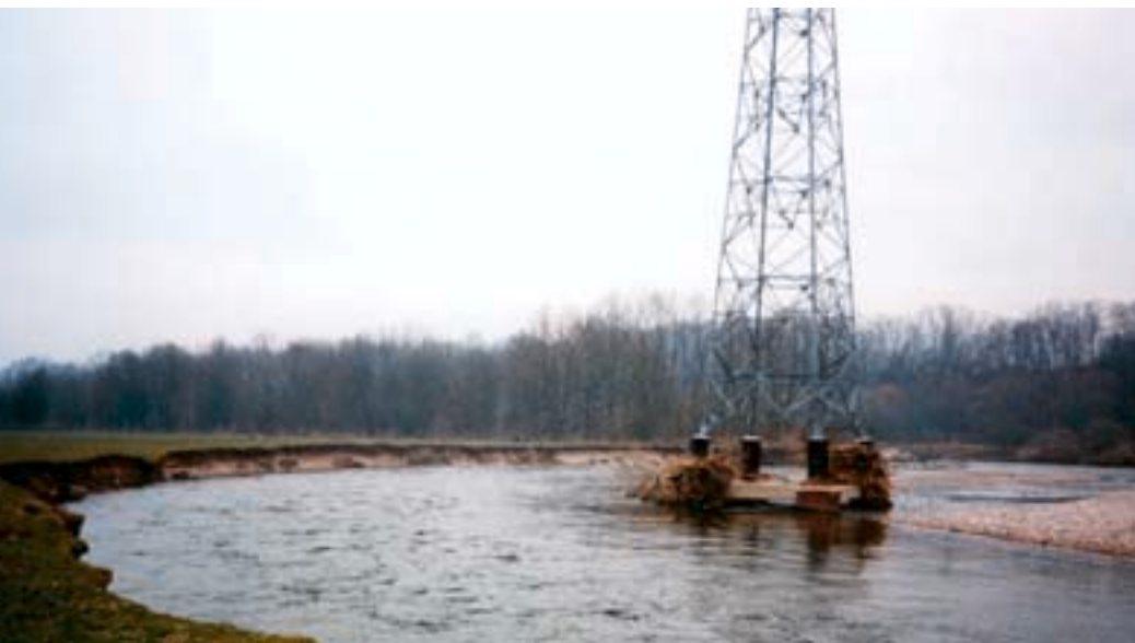
Pylône EDF "repris" par la Moselle (voir encadré)

potentiel de production intéressant. En effet, l'intérêt d'un pompage destiné à l'alimentation en eau potable (AEP) dépend tout autant des débits potentiels, étroitement liés à la transmissivité, que de la qualité physico-chimique de la nappe. Cette ressource représente une manne importante pour les années à venir et doit faire l'objet de la plus grande attention de la part des acteurs locaux.