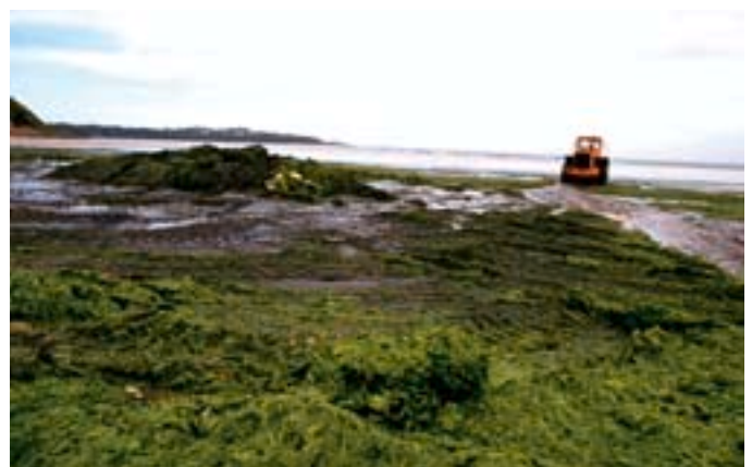
Marée verte, baie de Saint Brieuc (22)