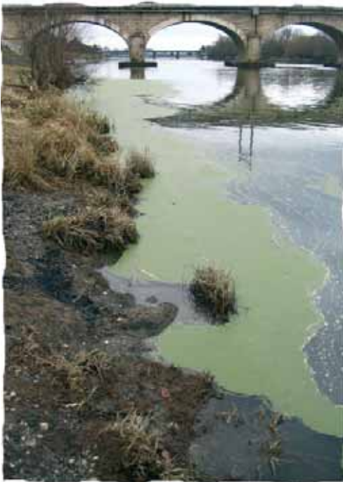
Le Filet, affluent recevant les intrants de la plaine maraîchère de St Martin-le-Beau (37), se jette dans le Cher au niveau de Tours.