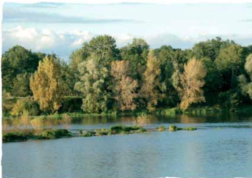
Rivière du Loiret (45)

L'analyse comparative de ces documents, transversaux par nature, n'est pas chose aisée. Chaque bassin est particulier, et se trouve confronté à des problématiques distinctes. Or, le SDAGE doit «coller» à cette logique du bassin, si bien que chaque SDAGE mérite d'être différent dans son contenu. Toutefois, un certain nombre de problèmes concernent tous les bassins, à des degrés bien entendu divers. Nous en avons