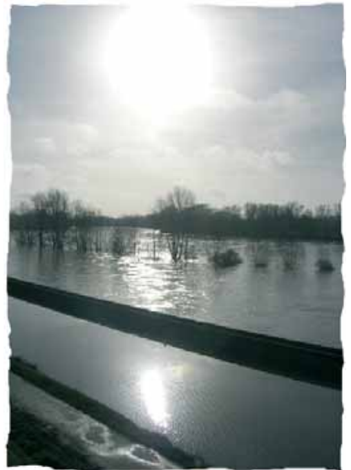
Canal d'Orléans en bord de Loire

passes à poissons (SN, RM, AP)... ce devrait être une obligation ;