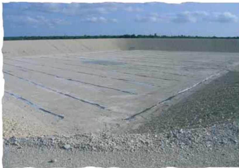
Retenue de Benon (17)

Les prélèvements importants dans les cours d'eau ou leurs nappes alluviales, destinés à