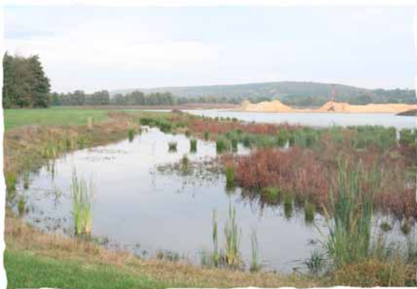
Sablrière sur l'Huisnes (28) en 2006

► La prévention des inondations (AP, SN, RM, RMed), y compris les risques d'intrusion marine liée aux changements climatiques (AP) ou l'endiguement sur le Rhin (RM), moyennant notamment la limitation de l'imperméabilisation des sols et la gestion maîtrisée des eaux pluviales (AP, SN, RMed, RM, le plus souvent sous forme de souhait) ;