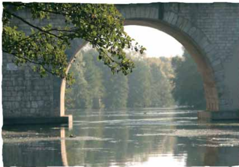
Rivière du Loiret (45)

Disposition à ajouter dans tous les SDAGE : un plan de réduction de l'exploitation de maërl (32) pour arriver à une cessation totale des prélèvements d'ici 2012, et l'interdiction de toute exploitation dans les cinq premiers milles nautiques (en raison de l'importance essentielle des zones de nurseries de la ressource halieutique).