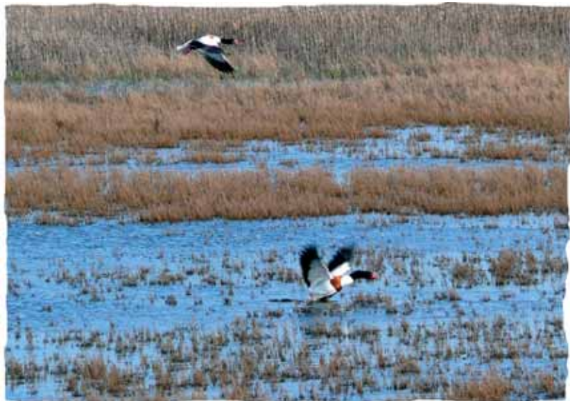
Tadornes à Pen Mané (56)

► L'interdiction des nouveaux drainages, leur inventaire et l'interdiction sélective et progressive de rénovation des drainages en place, par exemple en priorité dans les ZRE.