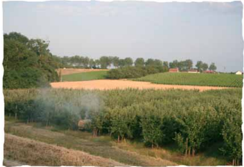
Epandage de pesticides dans le Loiret

En France, le milieu agricole est responsable de plus de 90% des apports bruts au milieu et de