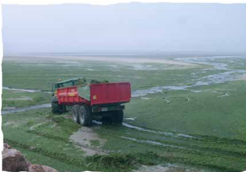
Ramassage d'algues vertes en Côtes d'Armor

Disposition la plus intéressante : la fixation d'un objectif de réduction de 30% des flux de nitrates sur certains bassins versants côtiers dont l'estuaire est soumis aux marées vertes (projet de SDAGE LB, disposition 10A-1 «littoral»)... Qui mais comment fait-on ? On réduit les épandages d'engrais et de lisier !