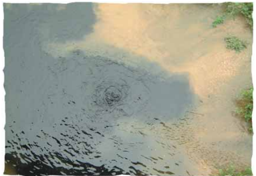
Rejet permanent non conforme, en Loire, de la station d'épuration d'Orléans la Source

Cette pollution se traduit d'un côté par des apports au cours d'eau de matière organique dont la dégradation entraîne l'anoxie des milieux aquatiques. Elle entraîne de l'autre l'accumulation et la fuite d'éléments toxiques dans les cours