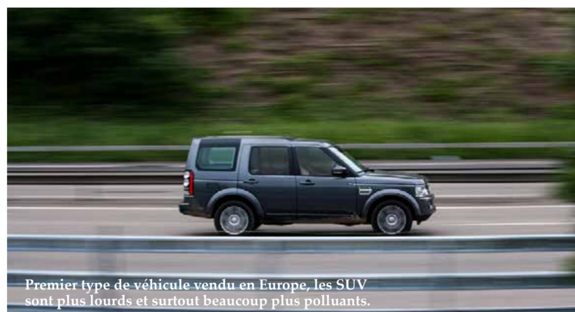
Premier type de véhicule vendu en Europe, les SUV sont plus lourds et surtout beaucoup plus polluants.

Face à ces renoncements en cascade, nous continuerons à défendre la voix des citoyen·nes et l'adoption de propositions ambitieuses pour une mobilité moins carbonée et plus inclusive : fiscalité juste dans les transports, repli de l'usage de la voiture, fin des projets d'extension des aéroports.