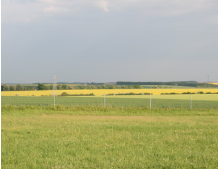
CHAMPS DE COLZA DANS LES PLAINES DU CHER (B. ROUSSEAU)