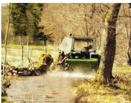
AGRICULTEUR LAVANT SON ÉPANDEUR D'ENGRAIS DANS UNE PETITE RIVIÈRE À VISCOMTAT DANS LE PUY-DE-DÔME