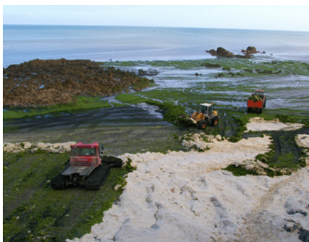
ALGUES VERTES SUR LA PLAGE DE HILLION EN BRETAGNE (G. HUET, 2009)